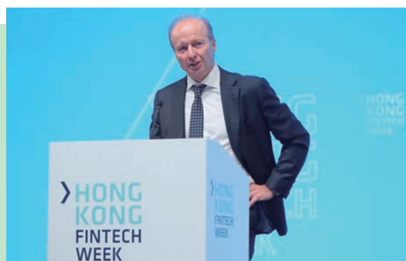
行政總裁歐達禮先生出席2019香港金融科技周

當我們就根據《證券及期貨條例》擬訂的規則進行公開諮詢時，所做的一直都較法定要求的為多。我們會就擬訂及修訂非法定守則及指引的建議向公眾諮詢。除了發表載有詳細建議的諮詢文件外，我們在諮詢過程中還會進行正式和非正式討論，以聆聽持份者的意見。