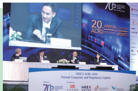
本會行政人員出席香港特許秘書公會舉辦的規管研討會

我們發表了《2018-19年報》和季度報告，以協助持份者了解我們的工作。本會榮獲香港管理專業協會頒發的2019年度最佳年報金獎和“可持續發展報告獎”，以及香港會計師公會頒發的2019年度“最佳企業管治大獎”公營機構組別“特別嘉許獎”，足見我們的匯報工作獲得肯定。