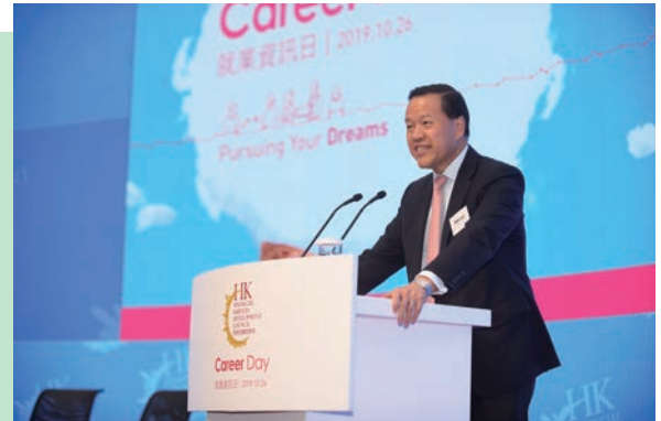
主席雷添良先生出席金融發展局就業資訊日2019

為介紹有關證券保證金融資活動的新指引，我們為100多名業界人士舉行了簡介會，並在本會網站上發布了一輯電子學習短片。約有1,000名業界人士參加了有關實施複雜產品銷售新規定的研討會。